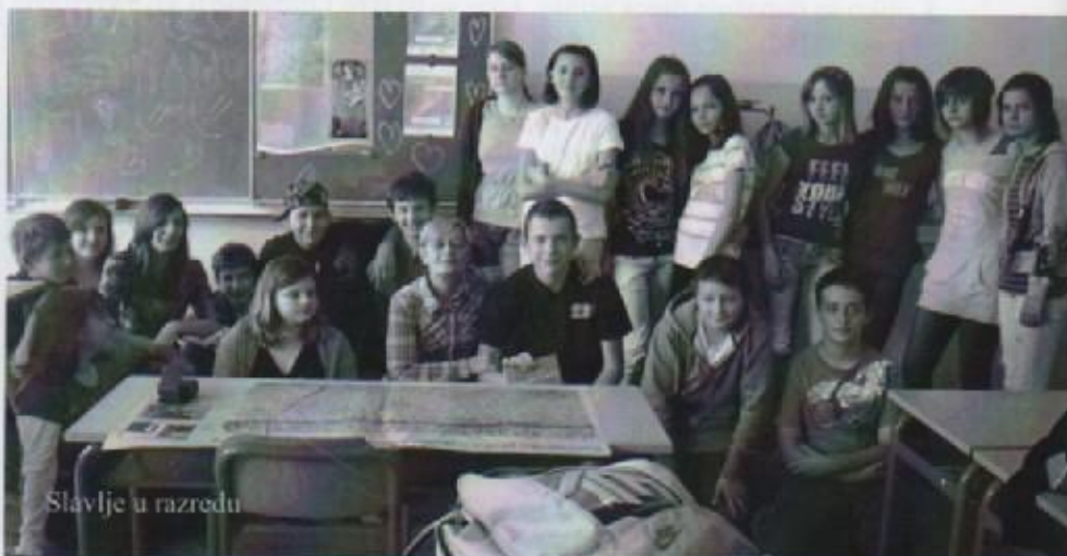
Slavlje u razredu

Drugoga dana natjecanja, nakon doručka, otišli smo u OŠ Josip Pupačić na pisanje testa. Natjecanje je započelo u 10 sati, a završilo u 11:30. Dok smo mi pisali test, mentori su otišli pogledati predstavu „Bazen u dvorištu“ Gradskog kazališta „Mali princ“. Blago njima! Čim su počeli dijeliti testove, još sam nekako bio siguran u sebe, ali kad sam vidio 1. pitanje moje se samopouzdanje raspršilo. Jednostavno mi ništa nije padalo na pamet. Tek sam se nakon 10 minuta pribrao i shvatio da ja znam odgovor na to pitanje koje uopće nije toliko teško. Ruka mi je nakon toga poletjela i riješio sam test 20-ak minuta prije roka. Vratili smo se u hotel na ručak. Uslijedio je izlet u Omiš. Obišli smo rodnu kuću Jure Kaštelana, HE Zakućac, sam Omiš (tamo smo se umalo izgubili jer je nastavnica htjela nešto kupiti), utvrdu Mirabela (ili Peovica)... sve u svemu bilo je odlično.