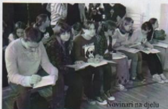
Novinari na djelu

Veslačke se utrke zovu regate, a osjećaj pobjede je super, potpuno se izbezumite.