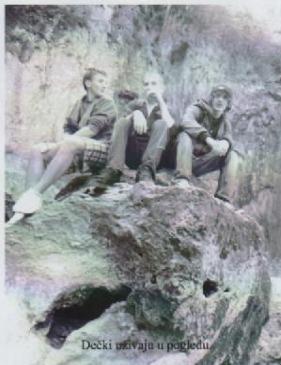
Dečki uživaju u pogledu.

I tako došao je kraj. Spakirali smo kofere, smjestili ih u autobus i krenuli kući. Svima je bilo žao, ali vratit ćemo se mi sigurno. Raspoloženje u autobusu bilo je veselo. Oko 21 sat stigli smo pred školu i ugledali naše roditelje kako nas nestrpljivo iščekuju. U ponedjeljak smo svi krenuli u školu, zadnju zajedničku godinu, s puno utisaka s ekskurzije i bliži nego ikad.