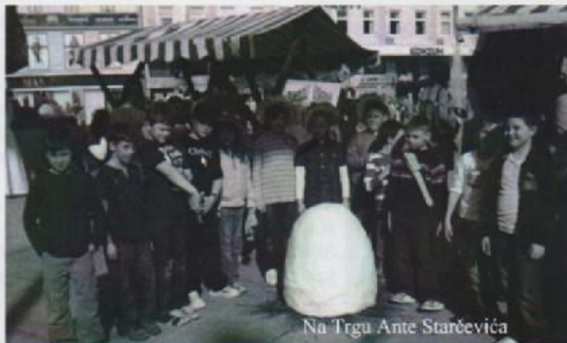
Na Trgu Ante Starčevića