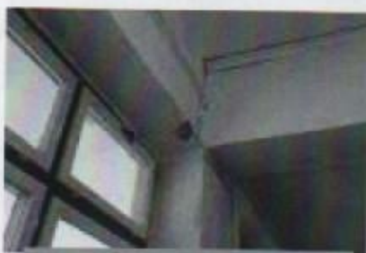
Dio oštećenog prostora u hodniku