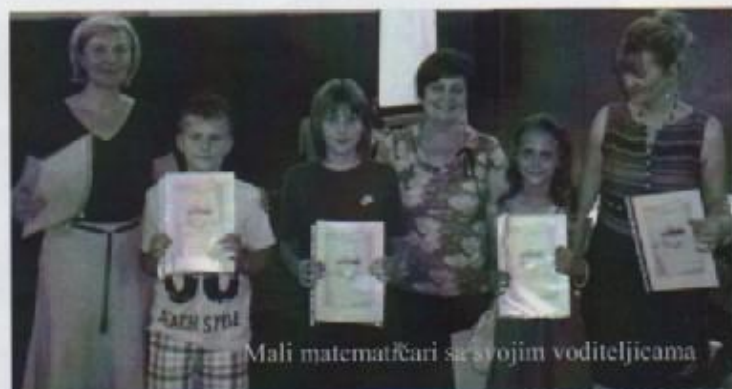
Mali matematičari sa svojim voditeljicama