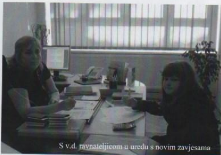
S v.d. ravnateljicom u uredu s novim zavjesama