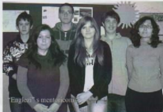
"Englezi" s mentoricom