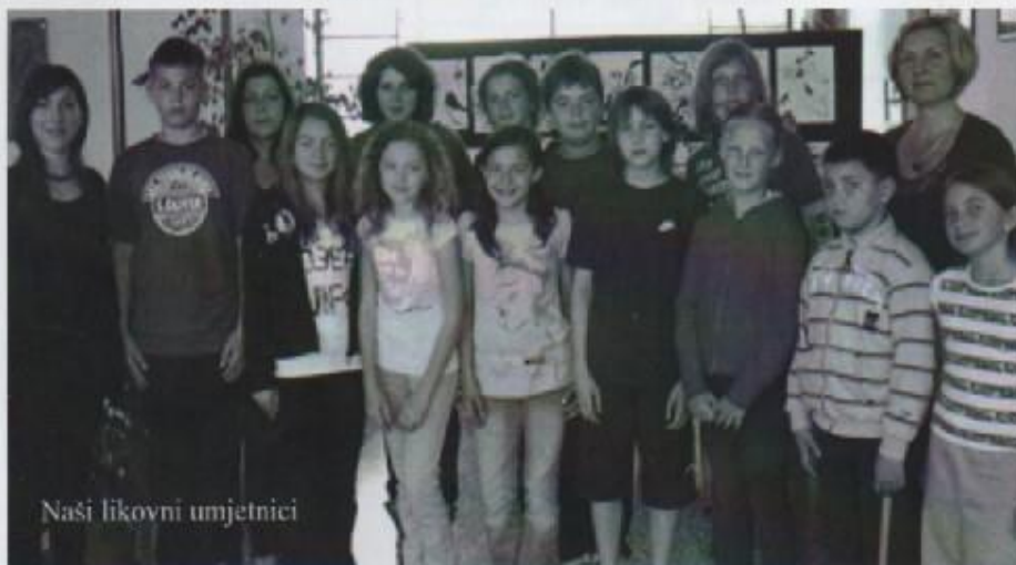
Naši likovni umjetnici