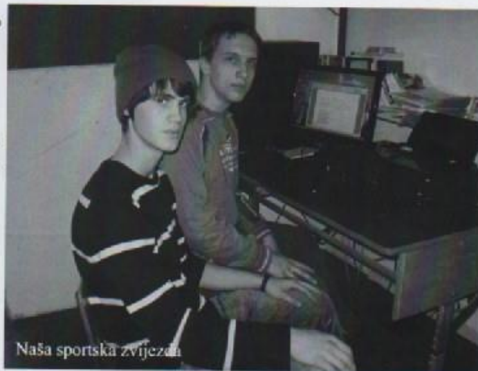
Naša sportska zvijezda

Imaš li problema s usklađivanjem školskih obveza i treninzima?