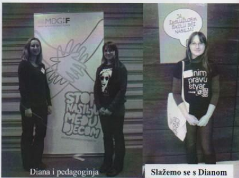
Diana i pedagoginja

Imala sam matematiku. Nastavnica iz matematike me poslala kod pedagoginje. Pedagoginja mi je rekla da sam izabrana da predstavljam OŠ Josipovac na četvrtom susretu Mreže škola bez nasilja. Ono se održavalo 11. i 12. studenog 2010.g u Zagrebu s temom „Održivost programa prevencije vršnjačkog zlostavljanja i Mreže škola bez nasilja“. Bila mi je čast predstavljati našu školu na jednom tako velikom skupu. Bile su sve škole iz Hrvatske koje imaju status škola bez nasilja, škole koje prvi put dobivaju status i škole koje obnavljaju status. Iz Osijeka smo krenuli 11. studenog u 05:30h. Bilo je predstavnika iz puno škola iz Osijeka i okolice. Iako smo bili umorni i neispavani brzo smo se opustili. Upoznala sam puno novih prijatelja. U Zagreb smo stigli u 09:00 i morali smo se registrirati, a stvari smo ostavili u sali za sastanke zato što sobe nisu bile spremne. Malo smo se odmorili i pripremili za svečano otvorenje skupa, pozdravni govor, zahvala sponzorima i svečana dodjela priznanja novim školama i školama koje obnavljaju status. Nakon toga otišli smo na ručak gdje smo se dobro najeli i dobili energije za nastavak rada. Nakon napornog radnog dana otišli smo na večeru. Kao šećer na kraju radnog dana gledali smo forum teatar. Zadivili su nas svojom glumom i maštovitošću.