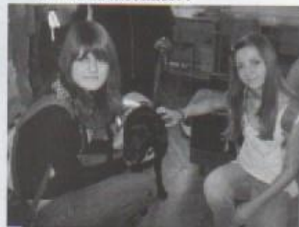
Didi se brzo sprijateljila

Didi je crni labrador školovan u Centru za mobilnost i