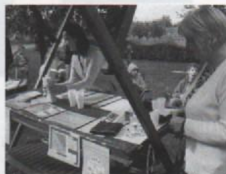
Predstavljamo vam zdrav život

bolest u cijelom svijetu. Udio masnog tkiva postaje sve veći u tjelesnoj težini ljudi. Debljina smanjuje kvalitetu života, radnu sposobnost i životni vijek. Stoga je Udruga „VAGA“ omogućavala posjetiteljima da se izvažu te doznaju je li to njihova idealna težina ili možda imaju višak kilograma. Udruga je još i mjerila visinu krvnog tlaka te šećer u krvi. Mnogi su zastali kod njihovog štanda i raspitivali se te poslušali neke savjete koji su jako korisni za zdrav život. Dijelili su letke u kojima govore o debljini te opasnosti od debljine i pretlosti te kako izgubiti višak kilograma i koji su uzroci debljine.