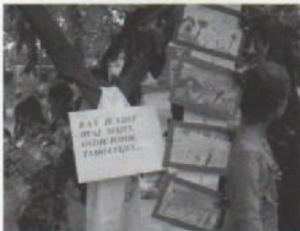
2.razred o prirodi

Zdrava hrana i zdrav duh U razgovoru s ravnateljicom saznali smo da je u tijeku projekt uvođenja zdrave hrane u prehranu učenika u školi. Tako je na primjer bijeli kruh zamijenjen polubijelim, pomfrit, grahom, a planira se