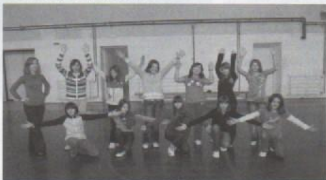
Naša plesna skupina