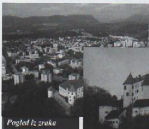
Pogled iz zraka

Gradić u nama susjednoj državi. Moj rodni grad