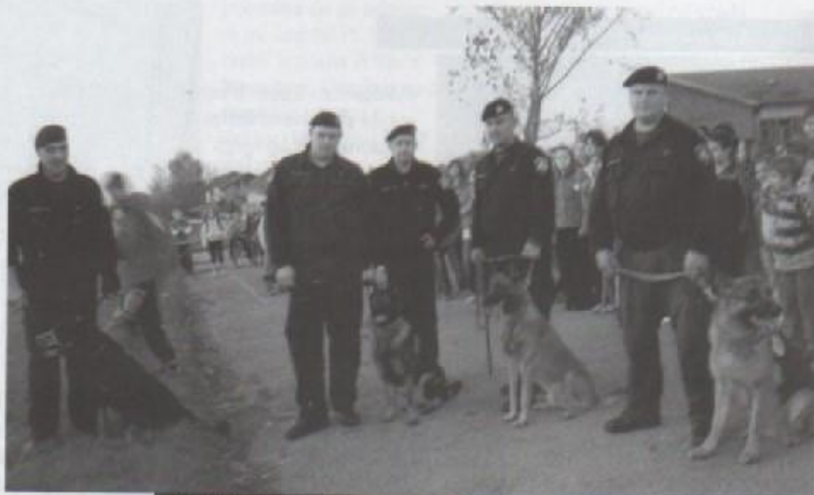
Naši Rexovi na djelu

Raspolažemo s pet pasa napadačke namjene: četiri rotvajlera i jednim belgijski ovčarom, jednim njemačkim ovčarom za slijeđenje ljudskog traga i jednim za detekciju eksploziva.