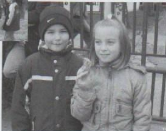
Mali Josipovčani u romantičnoj vožnji kočijom

dvadesetero djece. Izvana je bila prekrivena žutim platnom, a preko njega najlonom. Vozili smo se kroz Josipovac, bilo je zabavno, a vožnja je trajala oko 15 minuta.