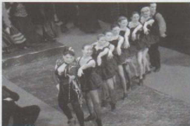
Naša pedagoginja u Orfeju u podzemlju

Trenutno se pripremam za Godišnju produkciju u plesnom studiju Temptation, a plešem i u burlesknoj operi „Orfej u podzemlju“, J. Offenbacha kao članica plesne skupine HNK.