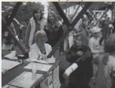
Mjerenje tlaka posjetiteljima

Udruga Vaga na našem sajmu je posjetiteljima predstavljala zdravi života te su posjetitelji