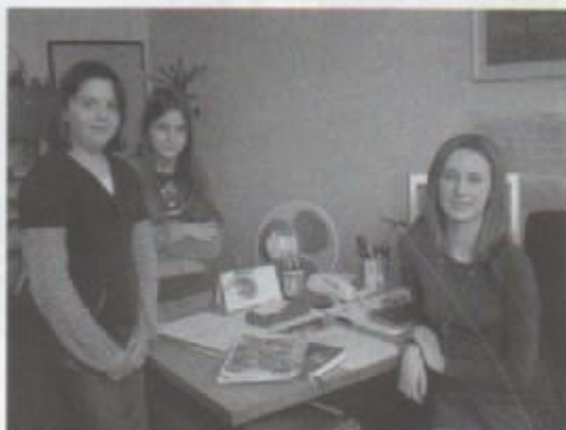
Novinarke s pedagoginjom

Koliko je ples kao fizička aktivnost zdrav? Koliko je zanimljiv? Koja je njegova sociološka uloga? Na ova i slična pitanja odgovorit će nam nova pedagoginja 0Š Josipovac.