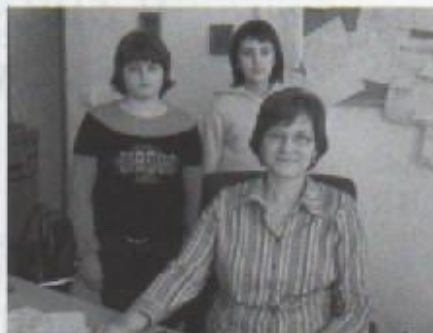
Intervju s ravnateljicom

nastaviti u istom duhu. Osim dobrog raspoloženja i apetita, učenici su pokazali i dobar, zdrav duh. Duh zajedništva. Naime, sredstva prikupljena prodajom navedenih proizvoda namijenjena su uređenju škole.