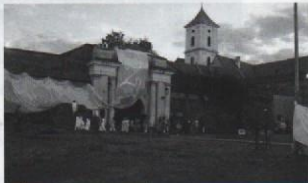
Čudesan svijet iz mašte ZEDA