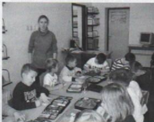
Prvašići u knjižnici

školu u kojoj ima puno radno vrijeme jer naša knjižnica radi samo ¼ radnog vremena. To nam predstavlja veliki problem jer nikad ne znamo kad knjižnica radi, a kada ne. Osim toga nedostaju nam i stolice. Ove godine novinarska skupina se sastoji od velikog broja članova pa nemamo gdje sjesti. Najnovija vijest je da smo dobili novo