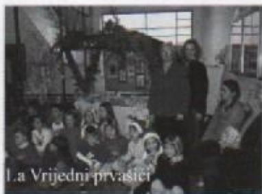
1.a Vrijedni prvaci