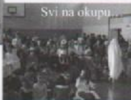
Svi na okupu...