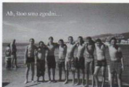
Ah, što smo zgodni...

Na naše odredište, točnije u Selce, malo mjesto u blizini Crikvenice koje je poznato po rehabilitacijskoj ustanovi gdje dolaze skijaši iz cijeloga svijeta i još točnije, u naš hotel, stigli smo oko 13.30 sati.