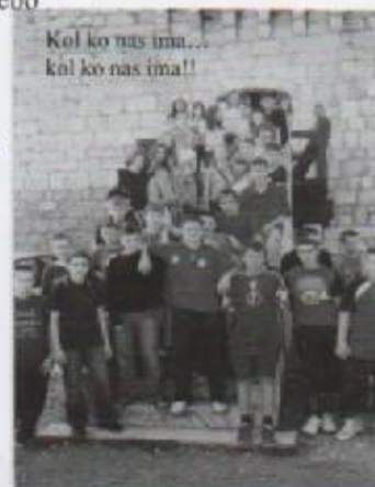
Kol ko nas ima... kol ko nas ima!!