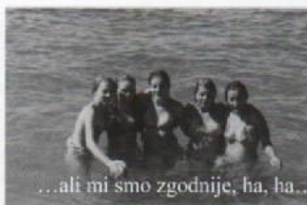
...ali mi smo zgodnije, ha, ha...

Drugi dan nakon doručka uputili smo se u obilazak Crikvenice. U Crikvenici smo vidjeli mnoštvo riba i ostalih morskih životinja. Dobili smo sat vremena kako bi prošetali gradom, popili piće i malo uživali bez učiteljskog nadzora. Vratili smo se na ručak. I opet je došlo vrijeme za ono najdraže, uživanje na plaži. A nakon toga krenuli smo u Novi Vinodolski, gdje je također bilo zanimljivo jer smo bili u Vijećnici Novog Vinodolskog i sjedili u jako udobnim stolicama. U muzeju smo vidjeli Vinodolski zakon najstariji povijesno pravni dokument, zakonski tekst pisan hrvatskim jezikom i glagoljicom. Donesen je 6.1.1288 u Novom Vinodolskom ( tada Novom Gradu).