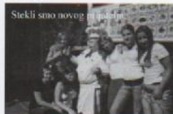
Stekli smo novog prijatelja.

Treći dan, nedjelja... Doručkovali smo i brodicom se uputili u Vrbnik, malo mjesto na otoku Krku, gdje smo hodali jednom od najužih ulica na svijetu. Naravno, vratili smo se na ručak i već poznatim redom «završili» na plaži, večeri, izlasku i trčanju po sobama, iako je tu noć jedan radnik obilazio hotel pa se nismo mogli vratiti u svoje sobe, nego spavali jedni kod drugih.