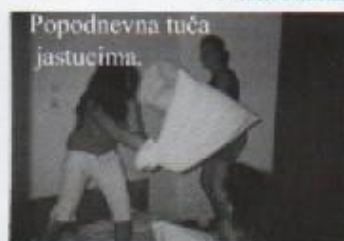
Popodnevna tuča jastucima.

Na redu su bili večera i izlazak, te iščekivanje da učitelji zaspu kako bi mogli šetati u sobe naših prijatelja.