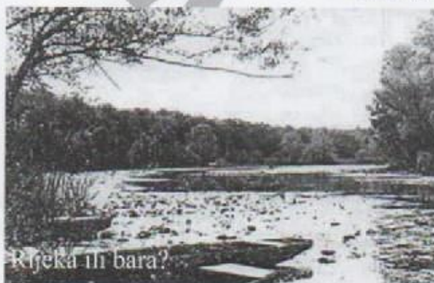
Rijeka ili bara?