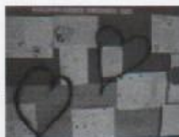
Pano s najljepšim pismima