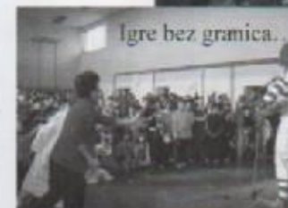
Igre bez granica...