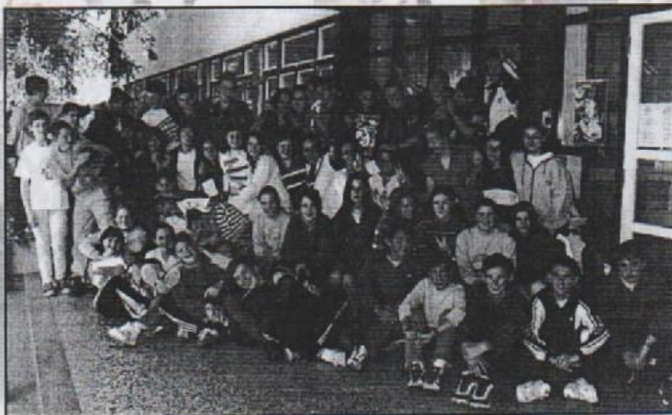
RAZREDI 8a i 8b

1.8. 1991. morala sam ići iz svog Almaša. Osam mjeseci provela sam u Njemačkoj, a potom smo stigli u Josipovac. Ispočetak mi je bilo teško jer sam u duši bila vrlo osamijena. Sada sam se priviknula na novo društvo i ljude u Josipovcu. Pitanje pravde često je mislima mojih rano sazrelih godina prekinutog djetinjstva. Upisat ću se u Ekonomsku školu u Osijeku.